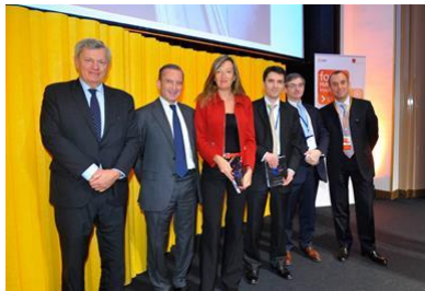
Remise des Trophées des achats EDF

Pour l'ensemble des photos rattachées à cet article: Crédit photo EDF© -Gil Lefauconnier