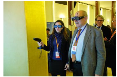
Démonstration de produit